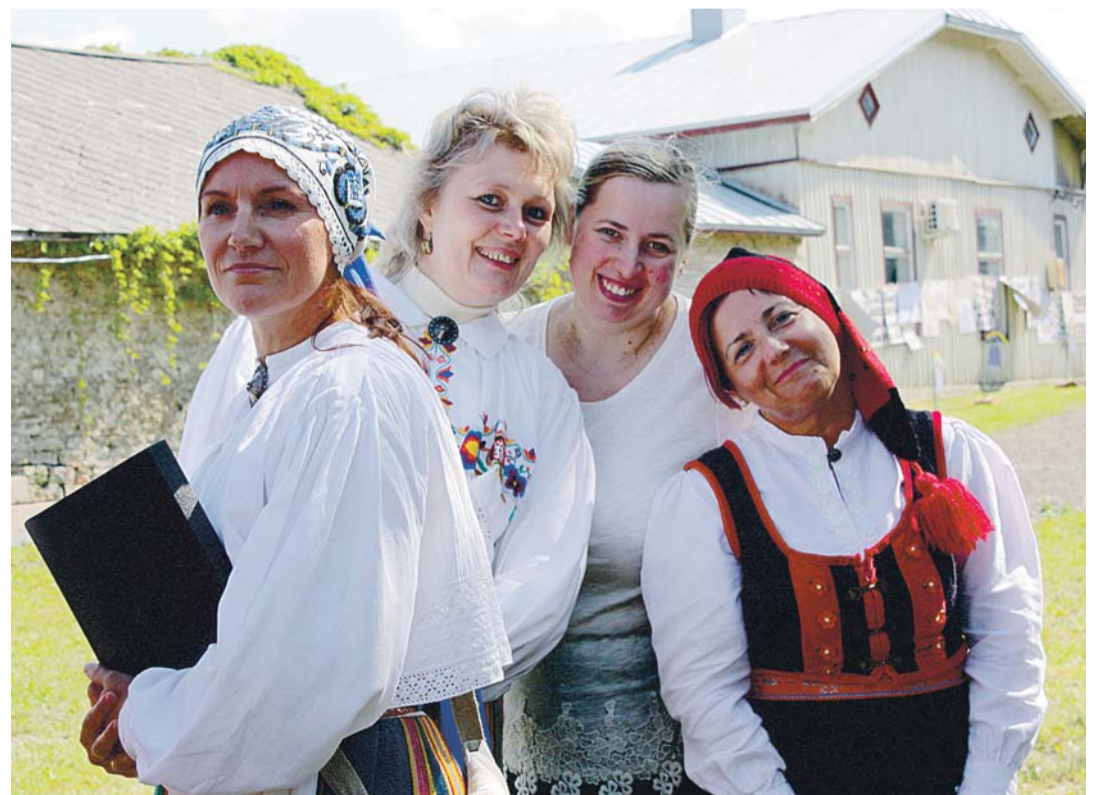
Laululinnud segakoorist Jõelähtme laulusõbrad pärimuspeol.

Lisaks kaapotkleidi koolitu- sele toimub sügisel ka kangas- telgedel kudumise koolitus. Õpime valmistama kangastel- gedel kootavaid üleviskeid, Kostivere Mõisa Näputöö-