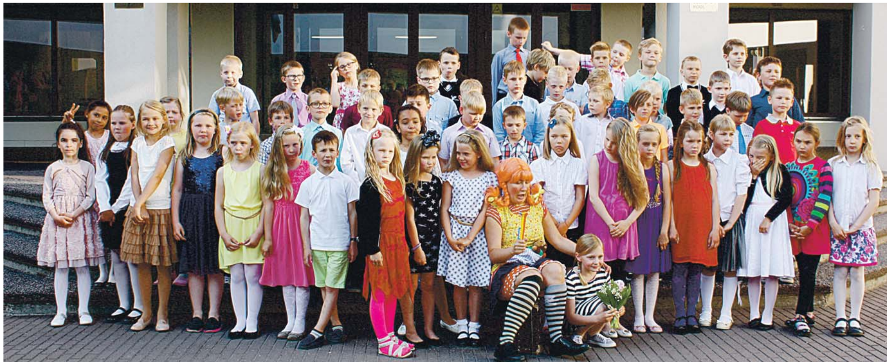
Loo Keskkooli esimese klassi lõpetas tänavu 64 õpilast, mis on kooli ajaloos kõikide aegade suurim lend.