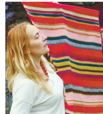
Uhke sõbakirjas vooditekk.

Rootsi-Kallavere küla muuseum loodab ka edaspidi uut ja vana näidata ning muuseumiüksused tulijatele lahti teha.