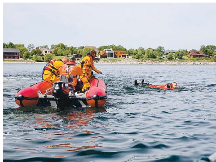
Merepääste ühisõppusel prooviti muuhulgas läbi pinnalt-päästmine.