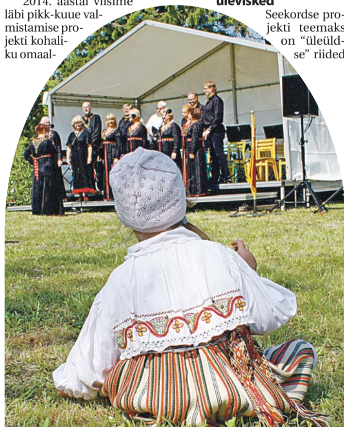
Rahvariide kandmise komme algab maast-madalast.