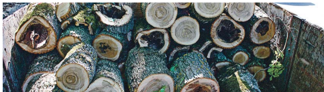
Vallamaja park kuulub Rebala muinsuskaitsealasse, mistõttu raietegevused nõuavad kooskõlastust.

vad navigatsiooniseadmed, CD-maki paneelid, sülearvutid, fotoaparaadid, mobiiltelefonid ja käekotid. Ühesõnaga kõik, mis on vähegi väärtuslik ja nähtaval kohal. Sõiduki küljeklaasi purustamine ning tähelepanu köitnud esemete autost haaramine võtab aega vaid mõned sekundid. Politsei kuuleb sageli kannatanute selgitusi, et ära käidi ainult hetkeks või pooleks tunniks... Kuid tegelikult ei mängi rolli mitte see, kui kaua ära oled, vaid see, kas autos on nähtaval kohal asju, mis köidab varaste tähelepanu. Seega nähtavalt kohalt tuleb ära panna kõik esemed, ka siis, kui lähete auto juurest ära kasvõi mõneks minutiks. Turvalisuse loomine on kõigi meie endi kätes ning kuritegusid ennetada on alati odavam. Ilusat suve ja hoiame oma varal silm peal!