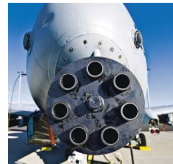
A-10 Ämari lennubaasis.