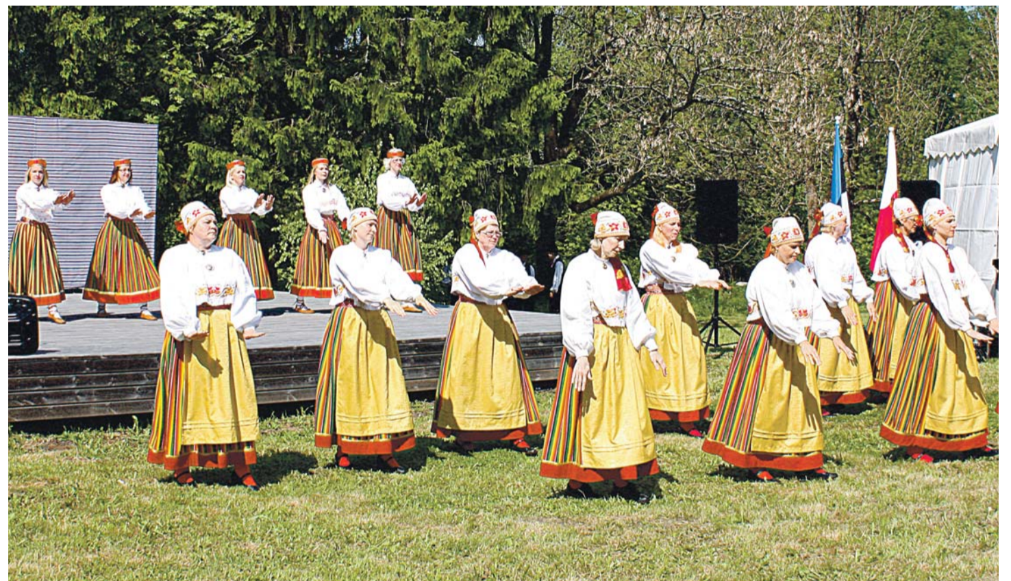
Pärimuspeol "Jõelähtme lätted" sai imetleda meie rahvarõivaste ilu.

Seekordse projekti teemaks on "üleüld- se" riided